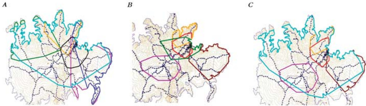
Figura 2. Ámbitos hogareños y distribución espacial de ocelotes con radio collares estudiados en la Isla de Barro Colorado (IBC). Basado en radiotelemetría Polígono Mínimo Convexo 100%. A) Machos: Color celeste = Bob; negro = Enc; verde = Bar; naranja = Mot; morado = Geo; azul = Isa. B) Hembras: morado = Yar; verde = Est; chocolate = Fra; rojo = Ore; naranja = Man. C) Cuatro hembras adultas (naranja = Man; rojo = Ore; chocolate = Fra; morado = Yar) dentro del área del macho Bob (línea de color celeste).

en las noches distancias de 1.15 km en promedio ( n = 79 ), con un máximo de 3.76 km y un mínimo de 0.03, y un registro extremo de un macho (Figura 2) que se desplazó 6.4 km (Tabla 1). Las hembras adultas recorrieron por las noches un mínimo de 0.02 km y un máximo de 2.4 km (promedio 0.7 km, n = 93 ) (Tabla 1). Mientras que los dos