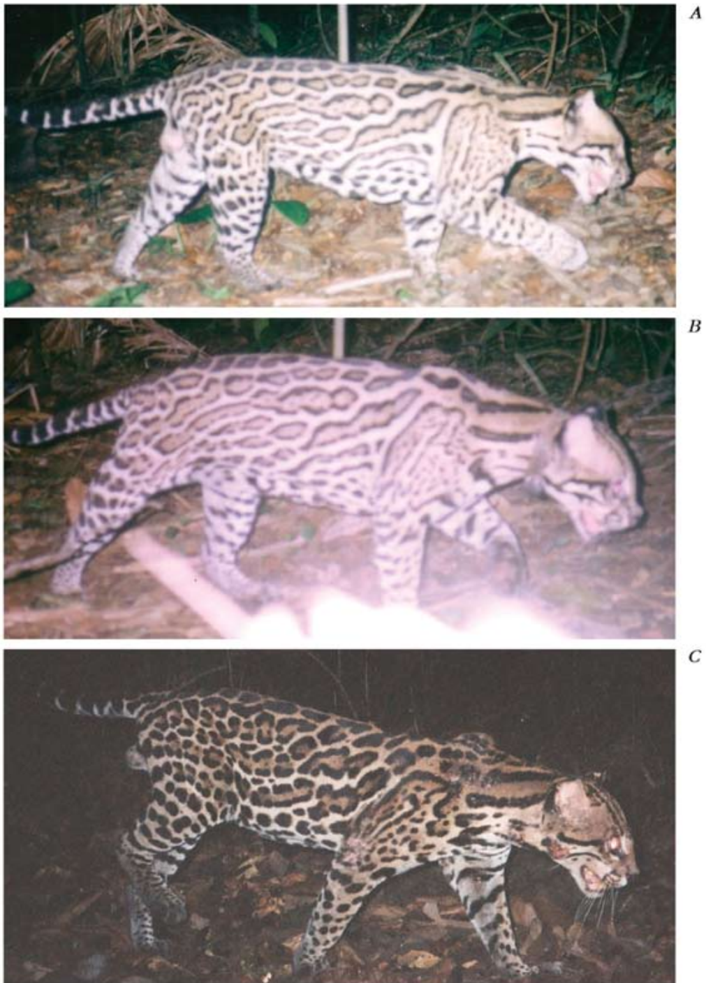
Figura 3. Fotografías de dos ocelotes machos captados con cámaras-trampa en la Isla de Barro Colorado (IBC). Fotos A y B es el mismo individuo (Bob), foto B muestra a Bob con radio-collar. En la foto C (Vag), se observa con patrones de machas diferentes a Bob.